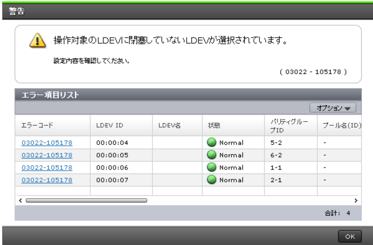
図 1-3 : 詳細付きメッセージ画面の例

一度に複数の項目を設定変更する操作では、メッセージの下に表示される表で、個々の変更結果を参照できます。個々の変更結果を参照するためには、表内のリンク付きエラーコード番号をクリックしてください。